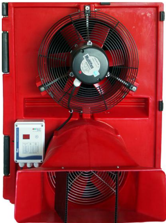
Regulador instalado en el recuperador